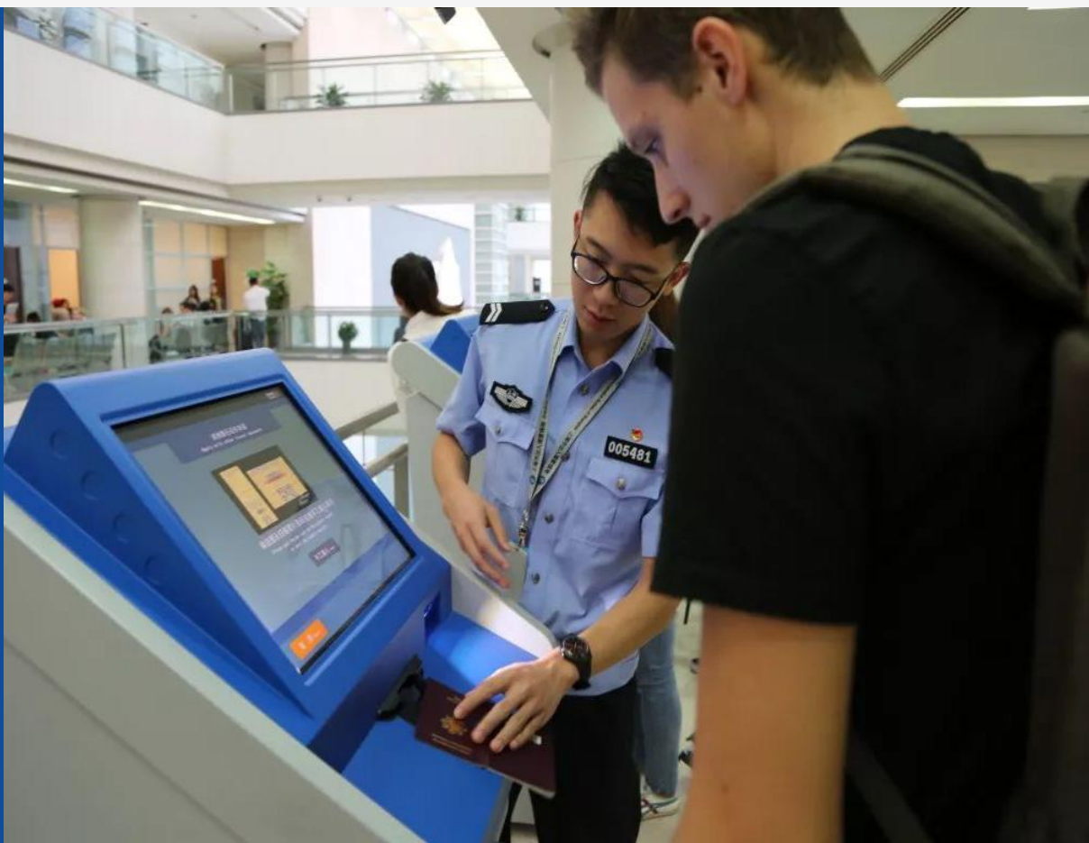
上海市公安局长宁分局出入境办公室