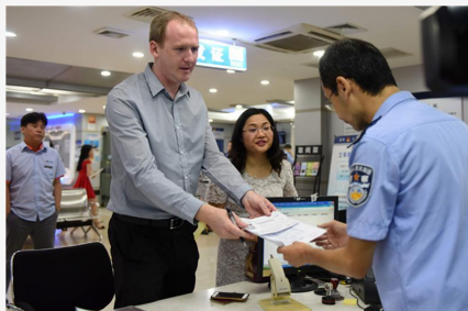
为有合理紧急事由的 外国人才办理短期的签证延期