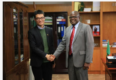
重要事务尚未办结